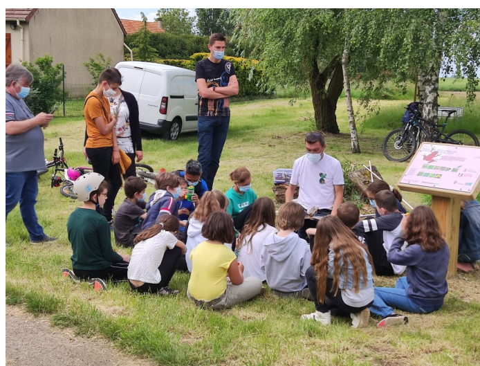
Fête des mares