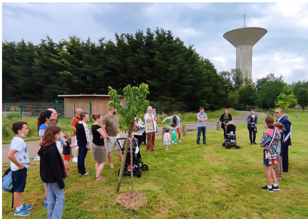
Un arbre, des enfants