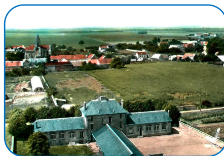
Mairie années 60