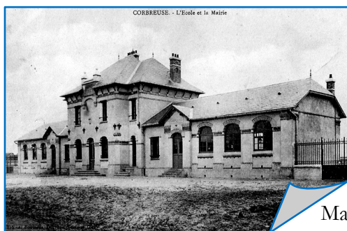
Mairie années 30